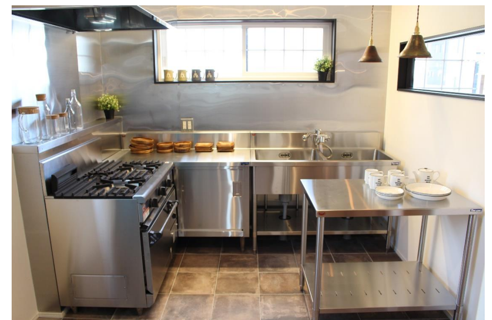
一般住宅ではあまりお目に掛からない業務用キッチン。壁面もステンレスで仕上げ、お手入れもし易く、存分に料理を楽しめる様になっています。