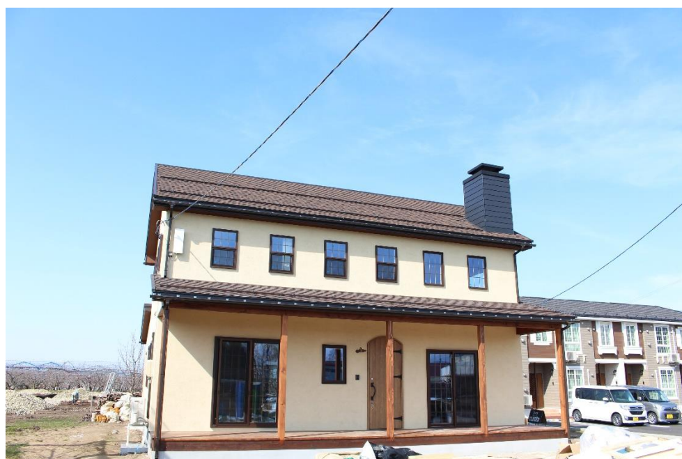
茶色の壁にカラーサッシがバランス良く配置された外観です。スサ入りの塗壁を使用してアンティーク感のある雰囲気を出しました。