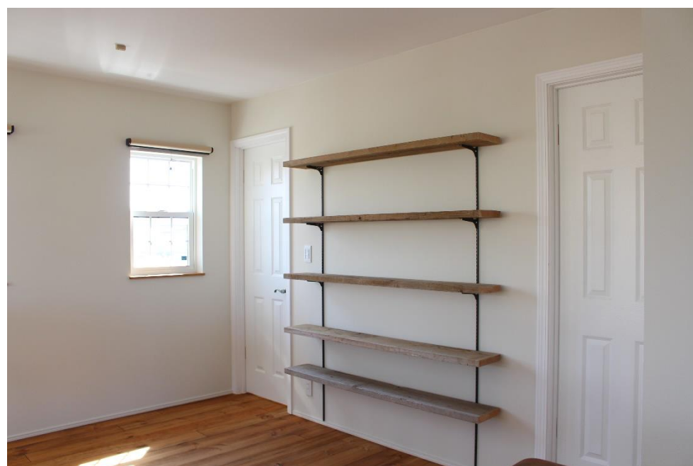
吹抜けから繋がるホールには足場板を使用した本棚を造作しました。冬は暖かくなる場所なので、読書スペースとして活用出来ます。