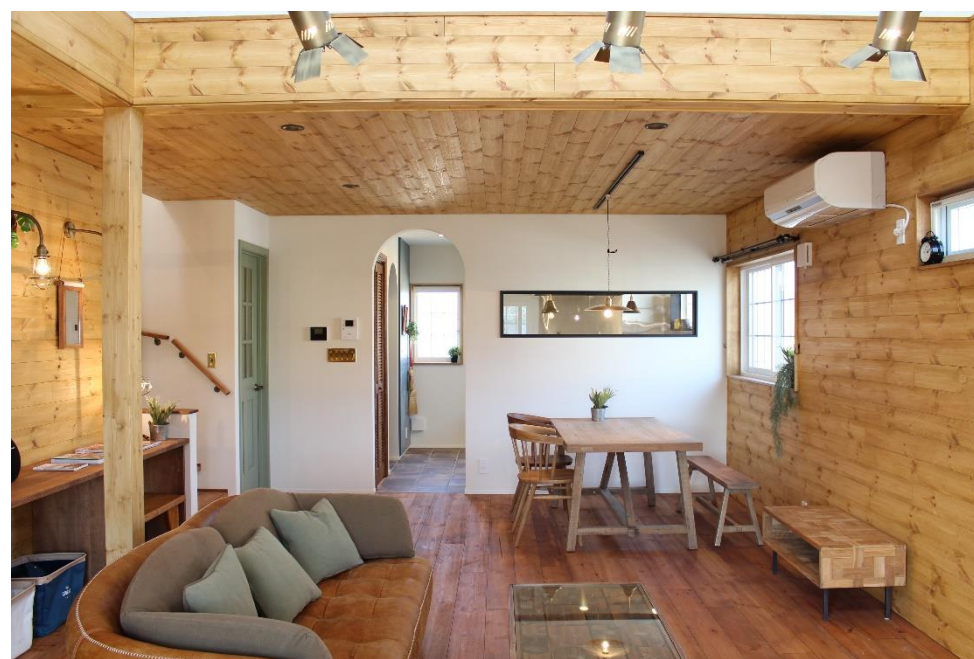
キッチンはオーナーが見たカフェの外観をイメージを取り入れて、ダイニングから横長のガラス窓を通して、少し奥が見える様になっています。