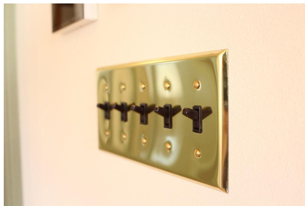
真鍮がお家の一つのテーマとなっており、スイッチプレートや照明器具など所々に使用して、お部屋の良いアクセントになりました。